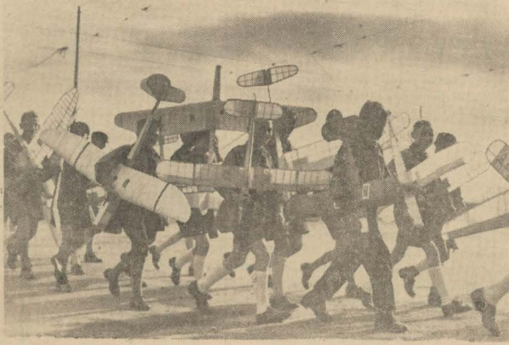
Başka memleketlerde havacılık: alman çocukları model tayyareleri uçuşmağa gidiyorlar

Posta şefi, amortisöre, pilotun öğrenmesi icab eden iniş vaziyetini hesap ederek halatları çekin emrini verdiğinden bu iniş hareketini takip ediyor ve sonra pilotun hatalarını ve iyi hareketlerini soruyor. Gençler hep bir arada,