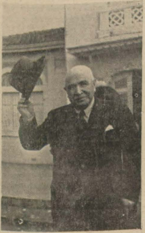
Bayındırlık Bakanımız B. Ali Çetinkaya

B. Ali Çetinkaya bu seyahatinde refikası kızı ve hususî sekreteri ile muhtelif sahelerde bir kaç mütehasıs refakat etmektedir.