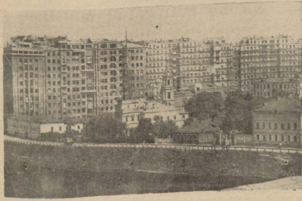
Moskovadan güzel bir görünüş