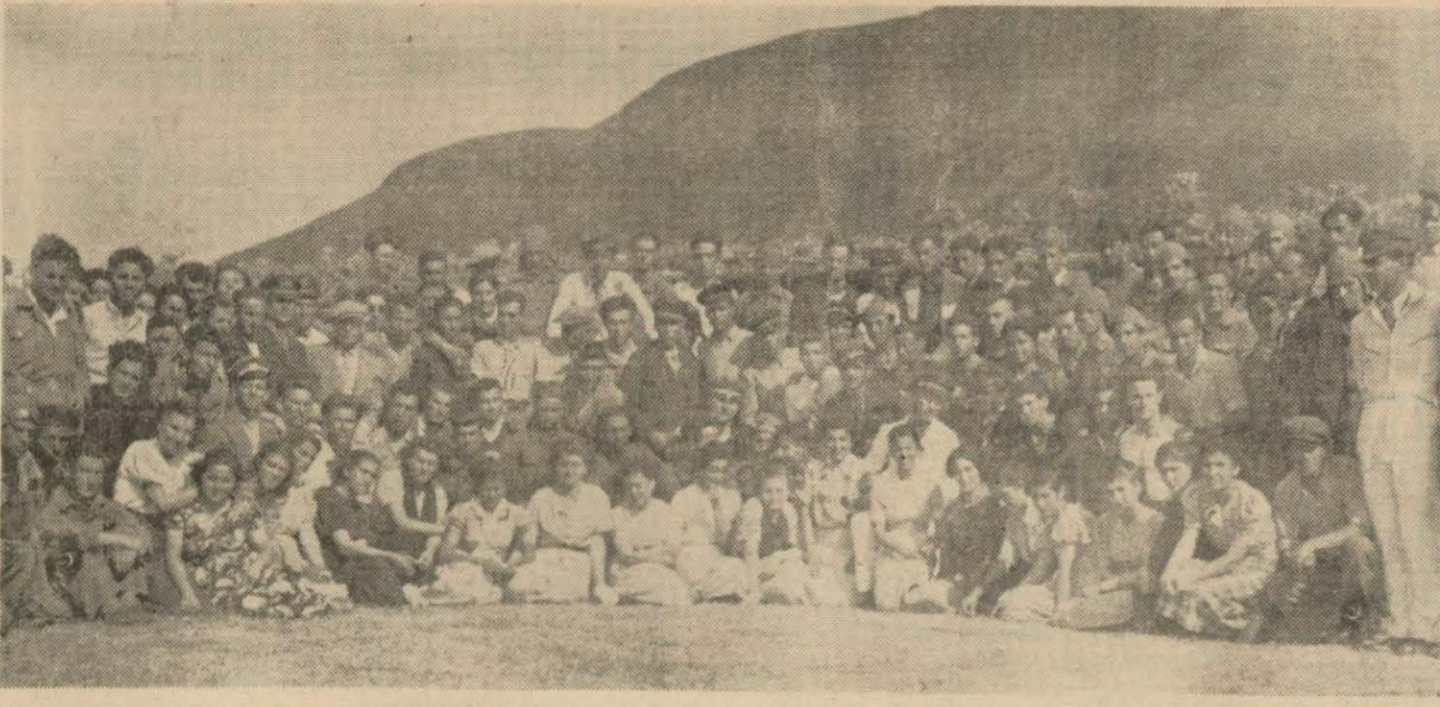
Türkkuşunun İnönü kampında çalışan gençler muallimlerle beraber