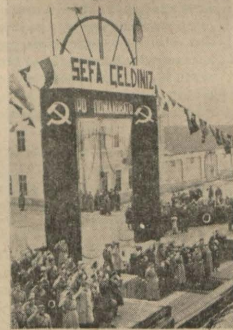
İsmet İnönü'nün geçen seferki seyahatleri esnasında yapılan tak