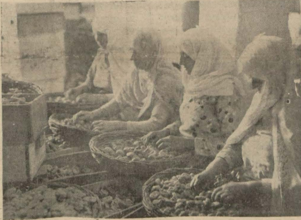
İzmir incirleri ambalaj yapılırken