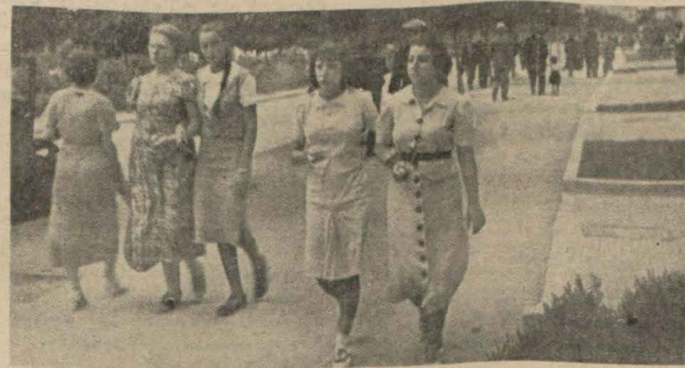
Yaz günleri asfalt cadde, serinlemek ihtiyacında olan ankaralılarla dolmaktadır. Yukarıda neşe içinde dolaşan genç kızları görüyorsunuz.

Stokholm, 14 (A.A.) — Türkiye nafıa vekili B. Ali Çetinkaya, bir kaç yüksek memurla birlikte buraya muvasalat etmiş ve istasyonda İsveç münakalât bakanı B. Forslund ve demiryolları umumî direktörü tarafından karşılanmıştır.