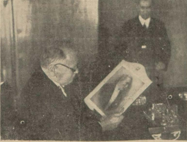
Sovyet Hariciye Komiseri B. Litvinof Atatürk'ün bir fotoğrafına bakarken