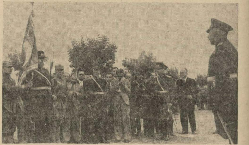
Orgeneral Fahreddin askere hitab ediyor.