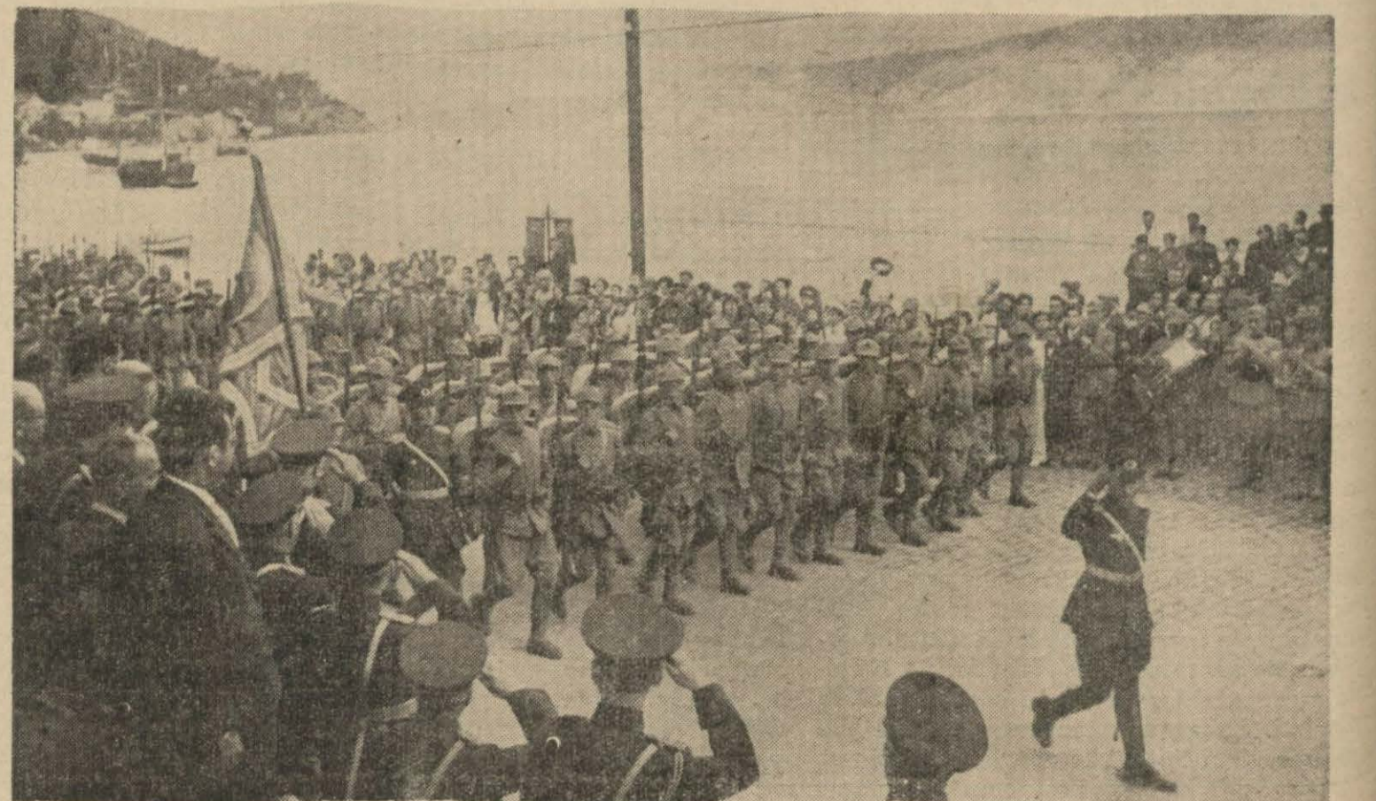
Sancak verilme töreninden sonra askerî geçid resmi