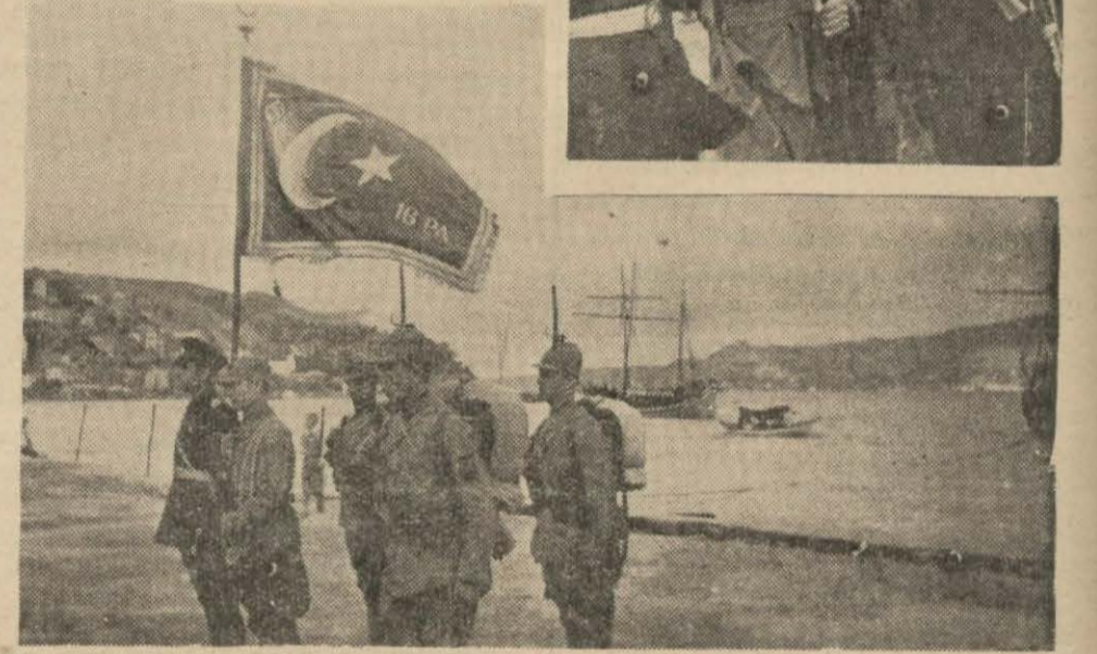
İstiklâl Marşı çalıyor ve Sancak dalgalanıyor

Sağdaki resim: Orgeneral Fahreddin Sancağı alay kumandanına vermeye üzere askerden alırken