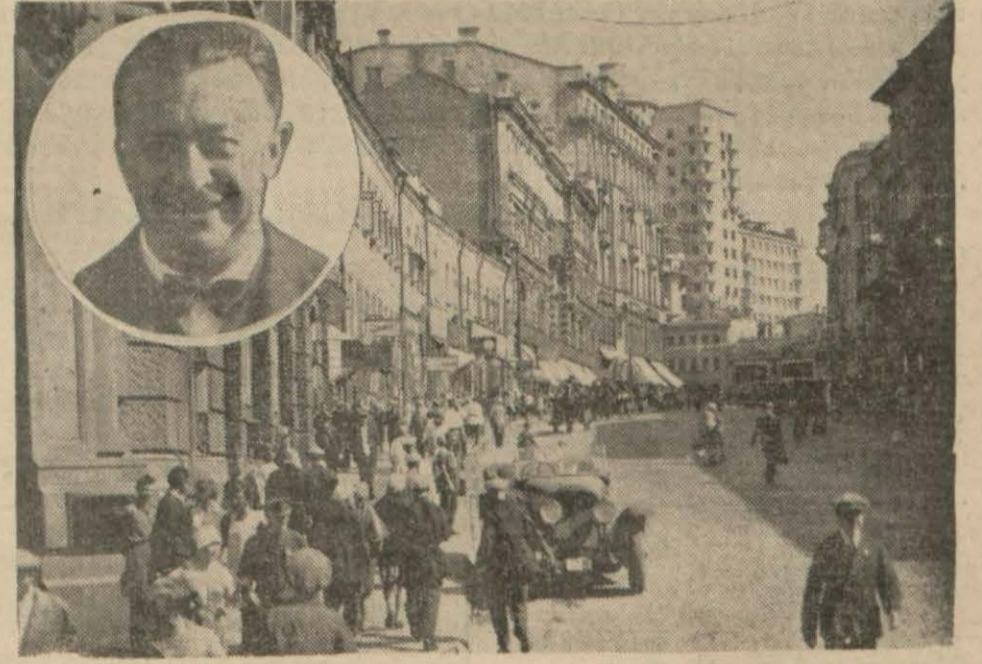
Moskovadan bir görünüş ve (madalyon içinde İç işler bakanı ve C. H. P. genel sekreteri B. Şükrü Kaya

Celâl Bayar istasyonda Ziraat Vekili Şakir Kesebir vekâlet ve müesseseler erkânı tarafından hararetle uğurlanmıştır. Celâl Bayar İzmirden bir kaç gün kalacak, belki Nazilliyeye kadar da gidecektir.