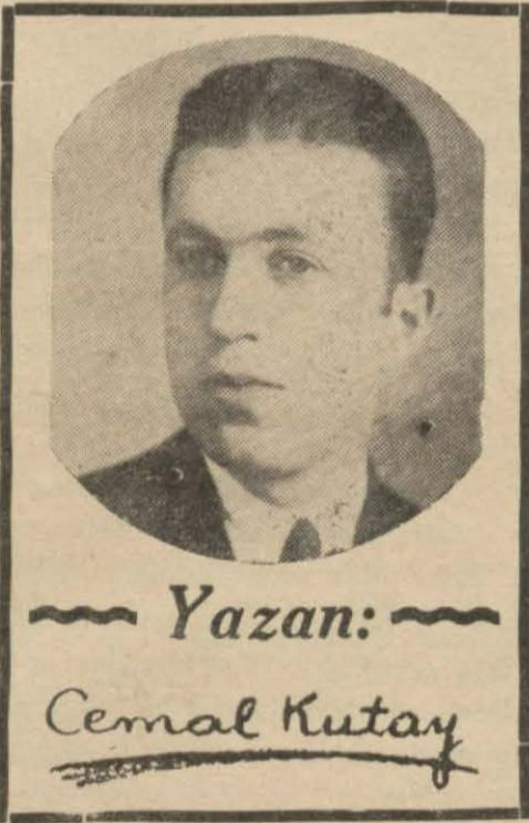
Yazan: Cemal Kutay

Ankara - İnönü yolunu, onun yolu kadar bilen yüzbaşı, bize gözümüzün önünden karaltılı noktalar halinde belirlip silinen köylerin isimlerini söylüyor. Başını arkaya çevirmeden ve bir istasyon memurunun itiyadıyla.. Bu karaltılara dikilen gözlerimiz, eğer orada su ve ağaç bulabilirse sevinçli, toprak arık ve çorak ise mahzun, yenilerine bakıyor.