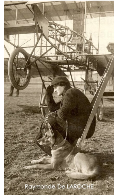
Raymonde De LAROCHE