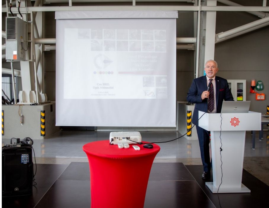
CAN'CA WOAW26 Konferansı: "Ulusal Havacılığın Gelişim Sürecinde 'İlk Uçan' Türk Kadınları"

RedStar Havacılık tarafından, "Uluslararası Kadınlar Günü" için 4 Mart 2026 günü düzenlenen etkinlik serisine özel konferans ile katılım sağlanmıştır.