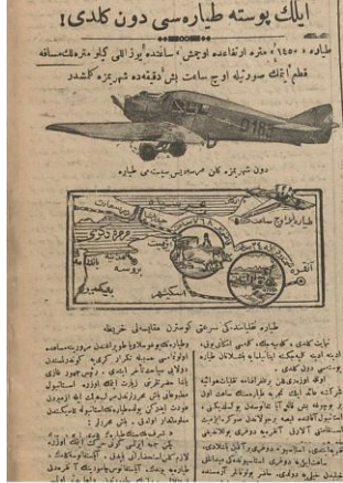
Anadolu'da Yeniğün (15 Şubat 1924)

JLT şirketinin, 14 Şubat 1924 Perşembe günü İstanbul- Ankara arasında yaptığı sefer, "Posta Tayyaresi" tanımı ile basında 15 Şubat 1924 günü oldukça geniş yer bulur: