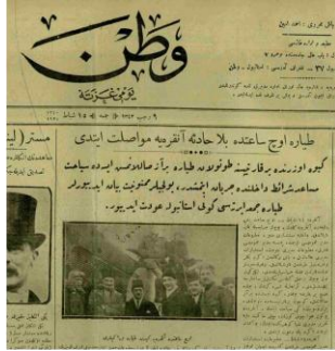
Vatan (15 Şubat 1924)