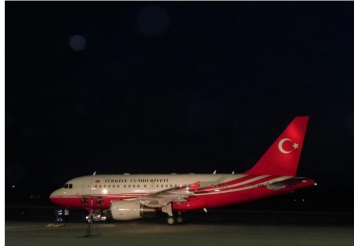
Pistteki İlk Uçak