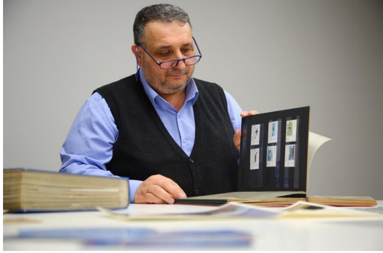
En keyifli anlarından birinde; koleksiyonu ile...

Bendeniz, sıcak bir temmuz günü İstanbul Fatih’te doğdum... Esnaf bir babanın, ev hanımı bir annenin beş çocuğundan biriyim.