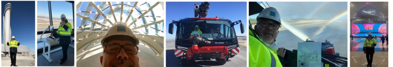
SHGM "İstanbul Yeni Havalimanı Sertifikasyon" Çalışmalarından...

Türk havacılığının en önemli projelerinden birinin, dünyanın ilgilenmenin de ötesinde, yapı, içerik ve detayları ile yakinen takip ettiği İstanbul Havalimanı'nın sertifikasyonunu ve terminal ruhsatlandırmasını yapan ekibin bir parçası olmaktan her zaman mutluluk, o seçkin üyelere sahip ekipleri yönetmekten onur duyacağımı belirterek başlamalıyım.