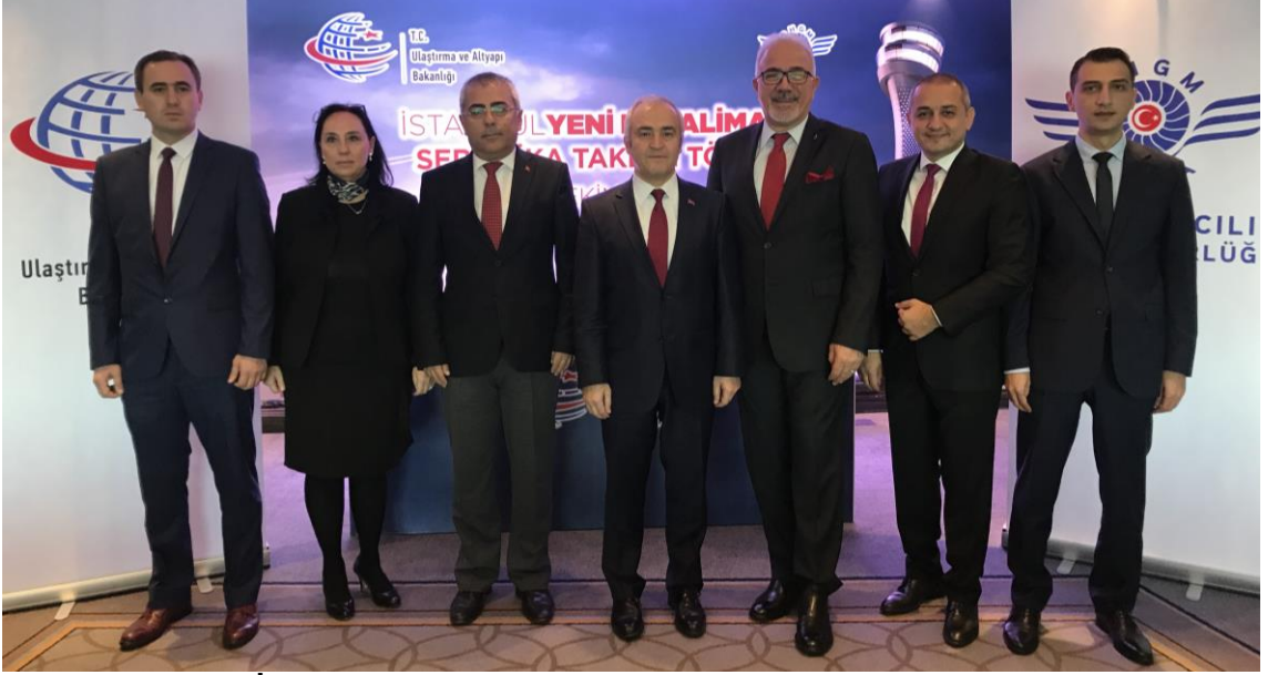
İstanbul Havalimanı Sertifikasyon Değerlendirme Kurulu