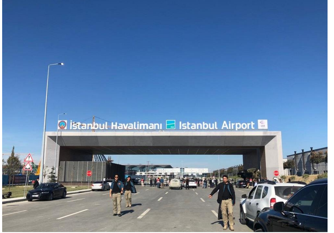
Açılış Töreni Sabahında Havalimanı Ana Giriş Kapısı

O yoğun günlere girişte tanışmamızla başlayan; ulaşımınızı sağlamak görevinin bende olması dahi benim için büyük mutluluk olmuştu.