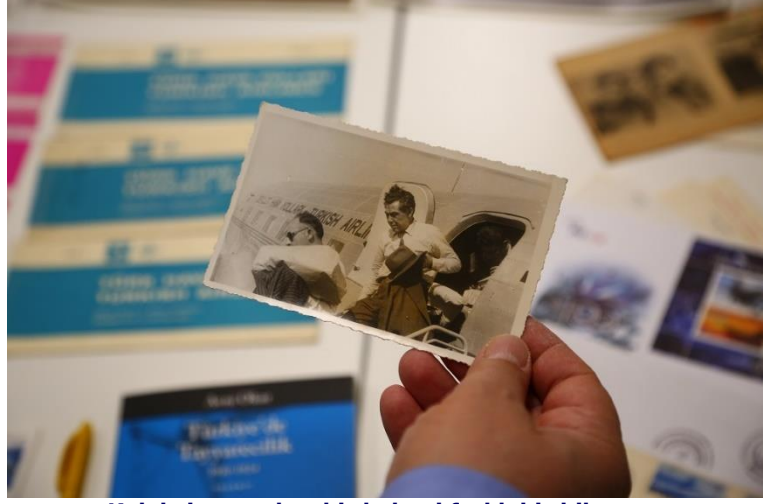
Koleksiyonun her bir kalemi farklı bir hikaye...