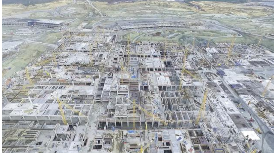
Terminal inşaatının başladığı günlerden...