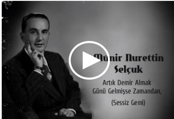
Video: " Sessiz Gemi "