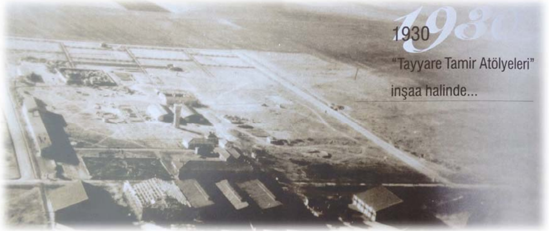
Eskişehir Tayyare Tamirhanesi 1930

Yüce Türk milletinin kaynakları ile özel bir ortak girişim (TOMTASCH Eskişehir Tayyare Tamirhanesi - 1926) olarak ulusal havacılığımızın -zaman zaman en önemli- bir tesisi olan ve günümüzde Türk Hava Kuvvetleri 1'inci Hava İkmal Bakım Merkezi adını alan kutsal meslek ocağı 1980'li yılların başından itibaren görev yapma ayrıcalığına sahip olan ben ve meslektaşlarım için bir teknoloji enstitüsü işlevine de sahiptir. Bu bir düşünce veya değerlendirme değil örnekleri ile ispatlanacak bir gerçektir!