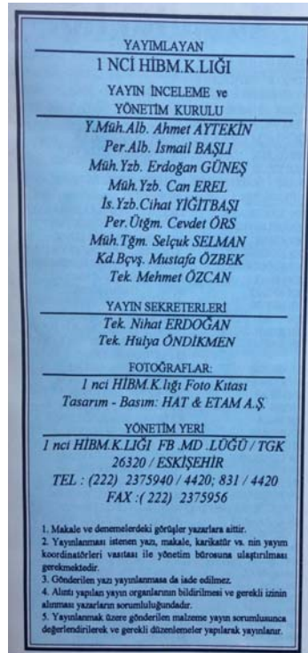
KOVAN #1 Yayın Künyesi © KOVAN

İnsan kaynağı, teknoloji, organizasyon ve yönetim, alanlarına odaklanmış özgün makaleleri yanında güncel olaylar, sosyal sorumluluk etkinlikleri ve faaliyetlerine yönelik haberleri de kapsayarak her iki ayda bir yayınlanmak üzere kurgulanan KOVAN'ın yayın hayatı 1998 yılında son bulmuştur