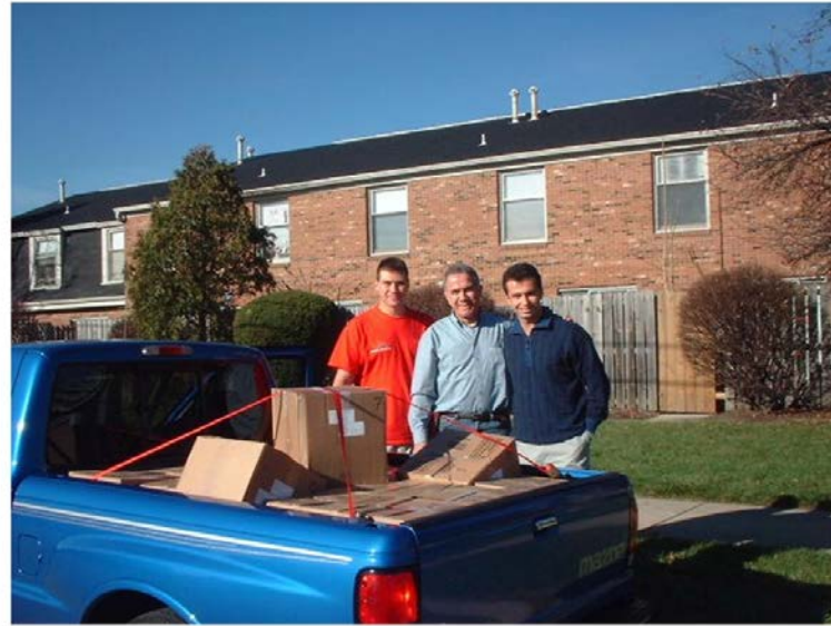
Kıtapların Nakli