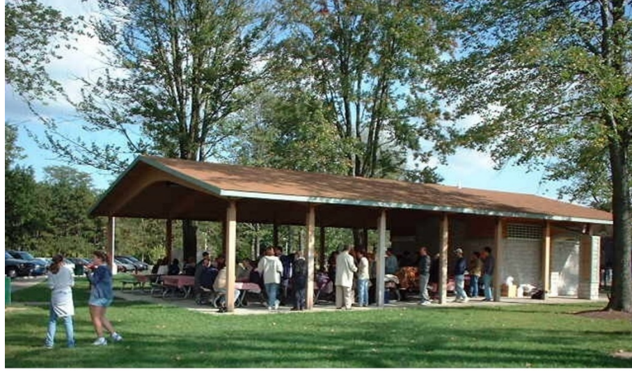
TTAA'nın 9/11 Yardım Fonuna Katkı Pikniği - 29 Eylül 2001