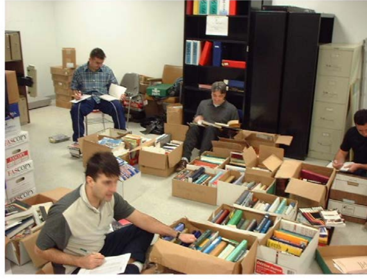
Kıtapların Tasnifi ve Gruplandırılması